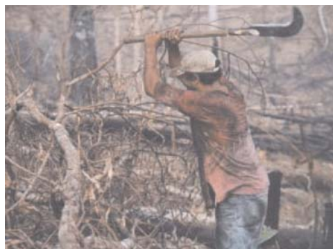
Trabalhador em regime de escravidão

A OIT (Organização Internacional do Trabalho) divulgou no último 11 de maio o relatório "Uma Aliança Global contra o Trabalho Escravo" no qual afir-